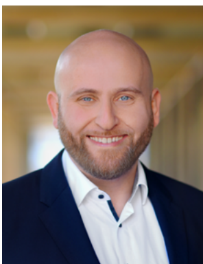
Leonid Chraga Vorsitzender Integrationsrat