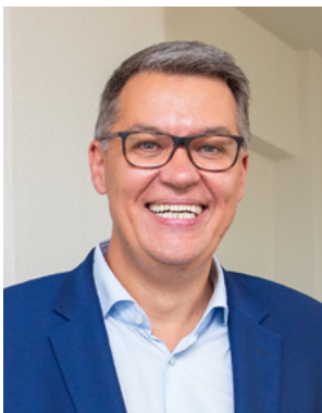
Thomas Westphal Oberbürgermeister der Stadt Dortmund