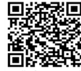
Friedhöfe Dortmund im Internet

Wir bieten ausserdem Grabfelder an, die nach den muslimischen und jüdischen Glaubensansprüchen angelegt sind.